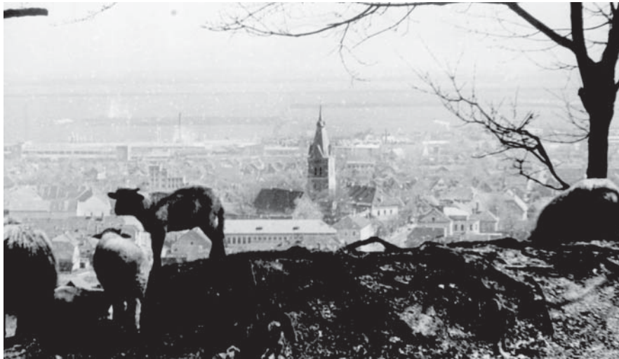
Zeiden. Blick auf die Kirche, davor das Schulgebäude

Ich bin eine ganz einfache Frau, mit noch vier Geschwistern in ganz armseligen Verhältnissen aufgewachsen, aber liebevoll von unserem leidgeprüften Mütterchen ehrlich und gottesfürchtig erzogen worden. Höhere Schulen habe ich nicht besucht. Viel-