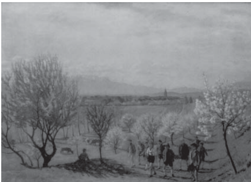
E. Morres: Zeiden mit dem Schuller (von der Steilau gesehen)

Unser Maler Morres lebte mit uns in Zeiden, er erlebte das Geschehen und konnte ihm auf wunderbare Weise künstlerischen Ausdruck geben. Ob in den Landschafts- oder Menschenbildern, immer hat er in seiner Darstellung das Wesen des sich ihm Gebotenen zu erfassen getrachtet und trefflich gestaltet.