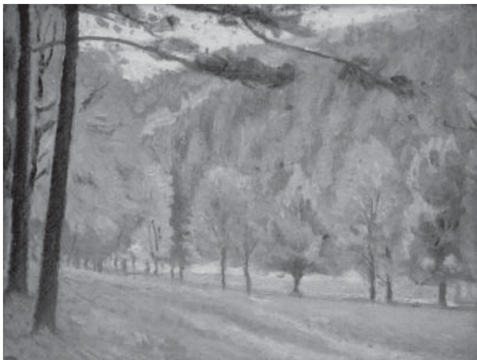
Eduard Morres: Schulfestplatz