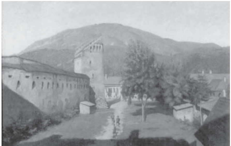
Eduard Morres: Weiberturm und Zeidner Berg

Eduard Morres: Bei der Drescharbeit