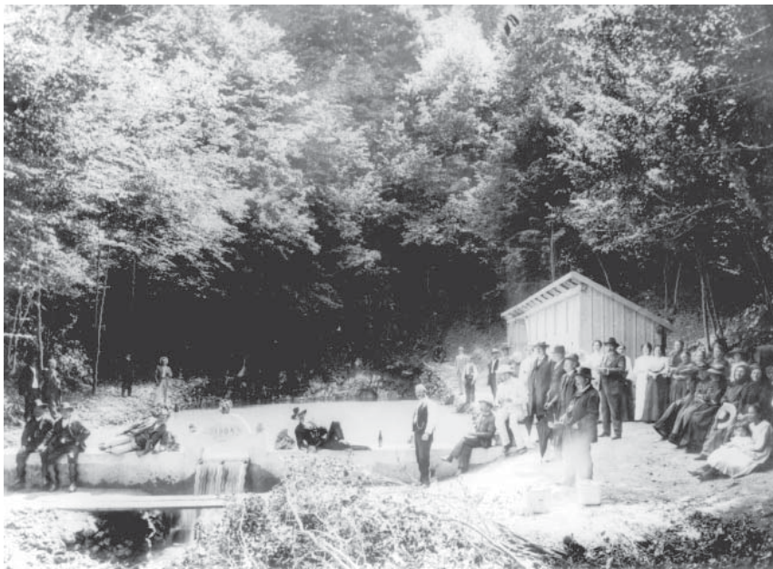
Einweihungsfeier des Waldbades am 4. Juli 1904