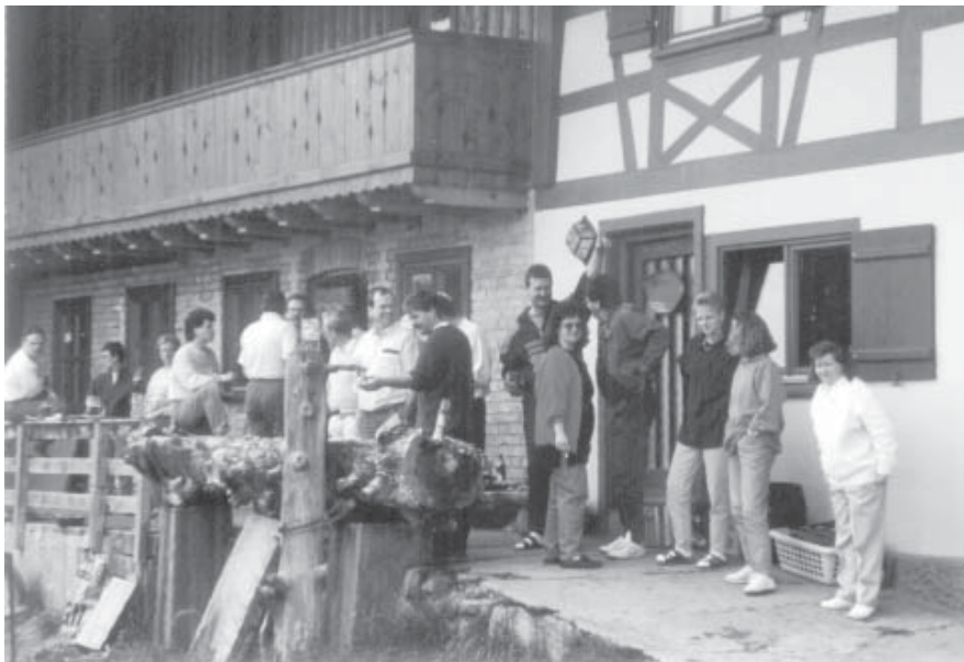
Viel Raum bot die Hütte – drinnen wie draußen

sich im Überlebenskampf in der freien Wildnis behaupten. Rund um das Haus waren Rinnsale und Bächlein, die von den Ein- bis Dreijährigen mehr oder weniger gekonnt, aber umso tapferer durchwatet wurden. Meist waren jedoch die Schäfte der Gummistiefel nicht hoch genug... So kam es