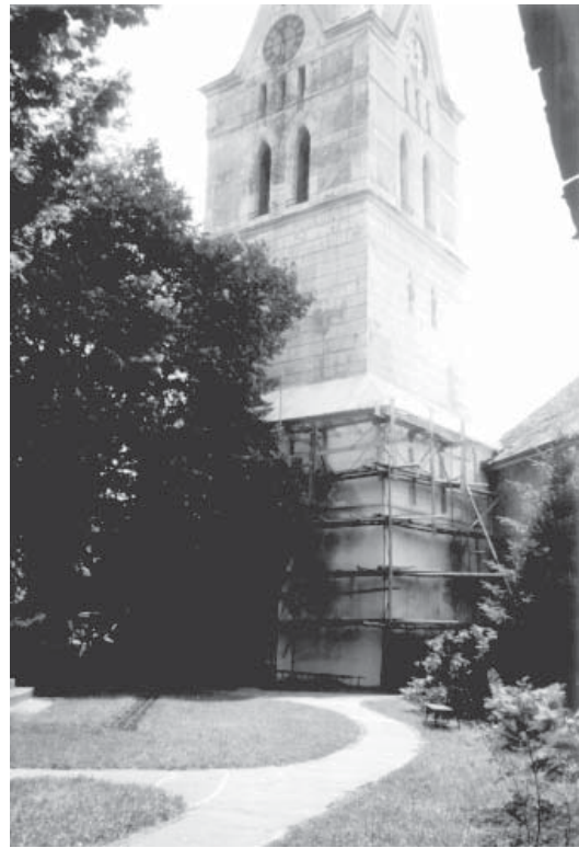
Der Glockenturm, 1994